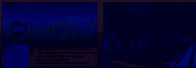
图 5-1-1 工程实践创新项目